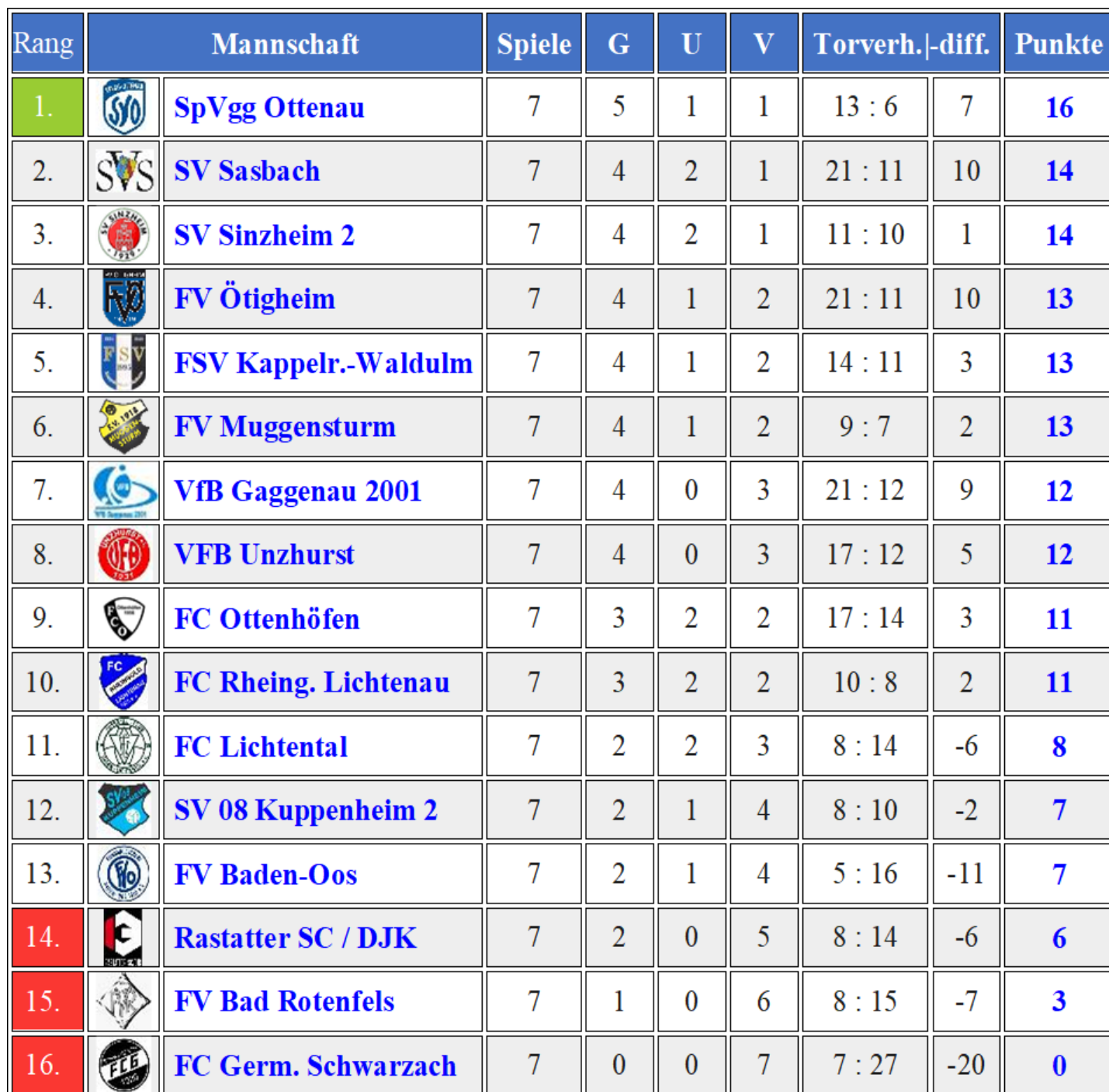
Tabelle nach dem 7. Spieltag