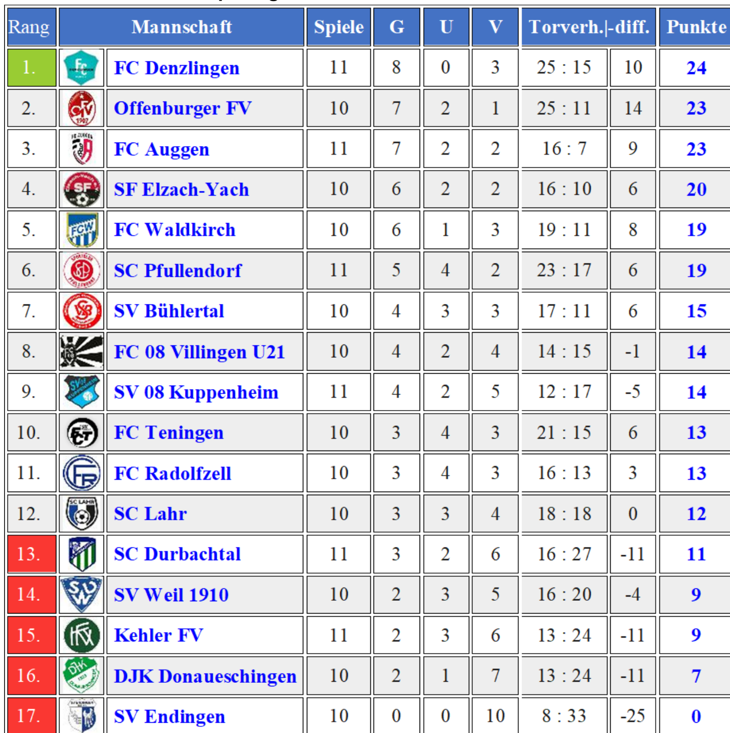
Tabelle nach dem 11. Spieltag