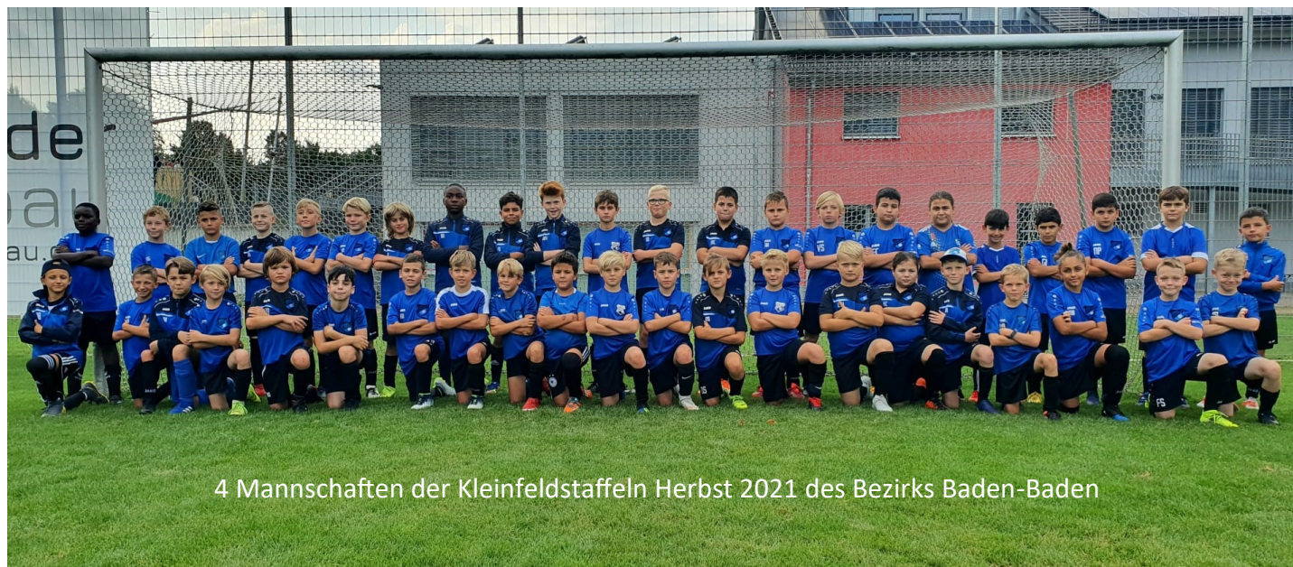
4 Mannschaften der Kleinfeldstaffeln Herbst 2021 des Bezirks Baden-Baden